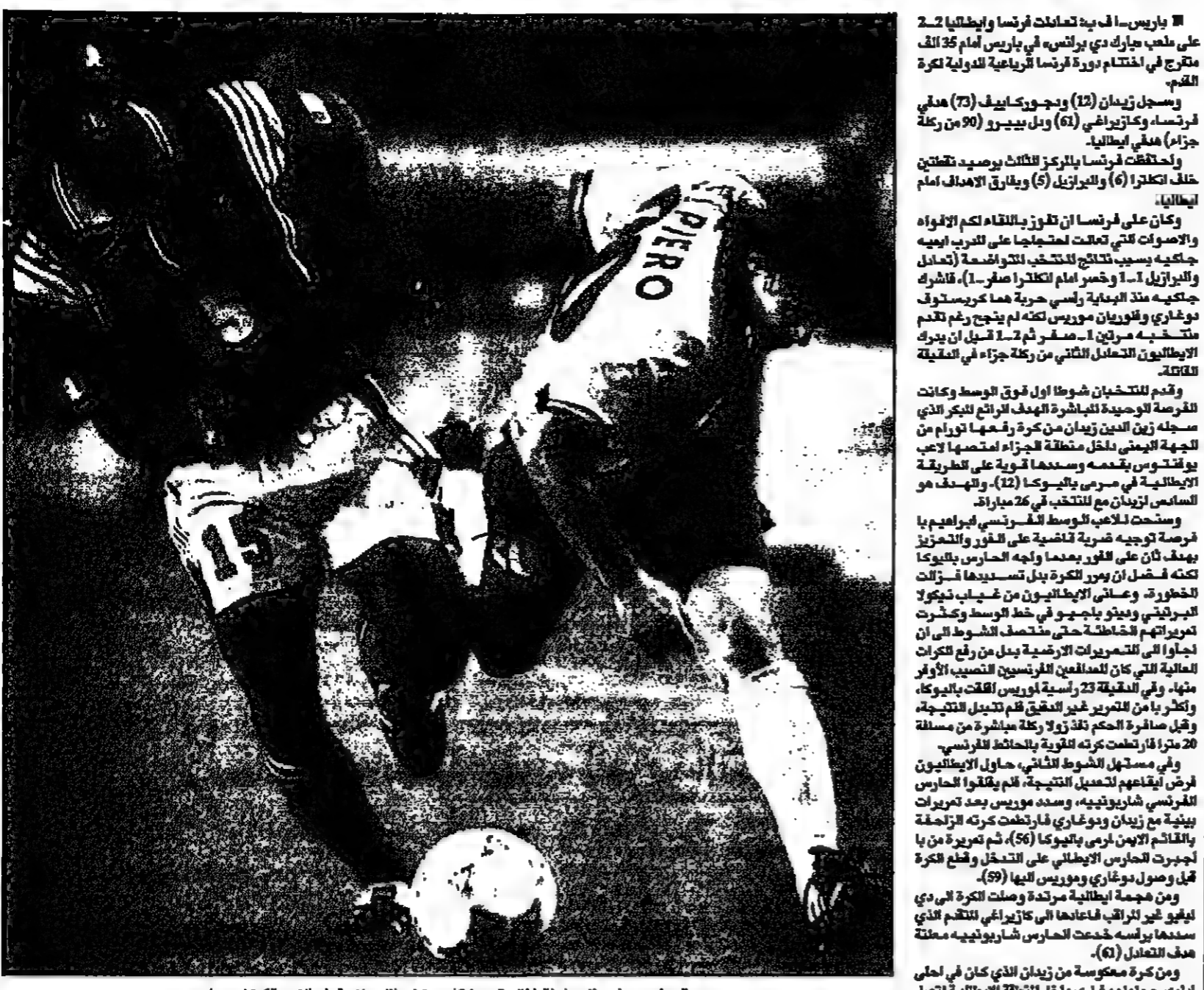
السياترو ديلور لاعب ايطاليا (اليمين) كاد يسقط خلال منافسة على الكرة بالكرة (روبيرت)